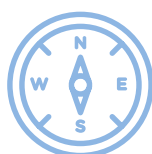
Etikos ir atitikties aktualijų puslapiai